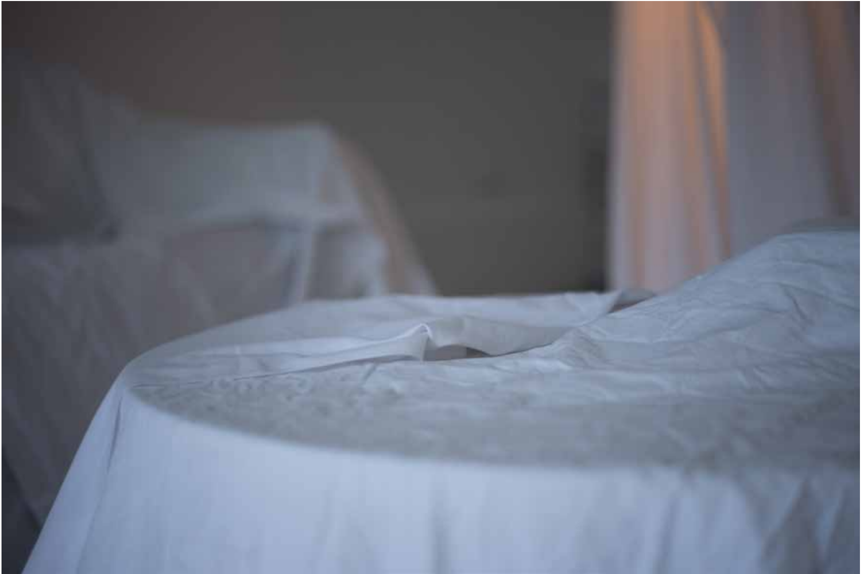
“Tulevikumälestus”, näituse detail