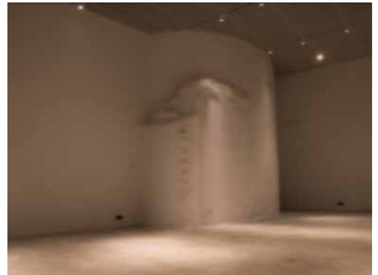
“Vare”, video kuvatõmmised