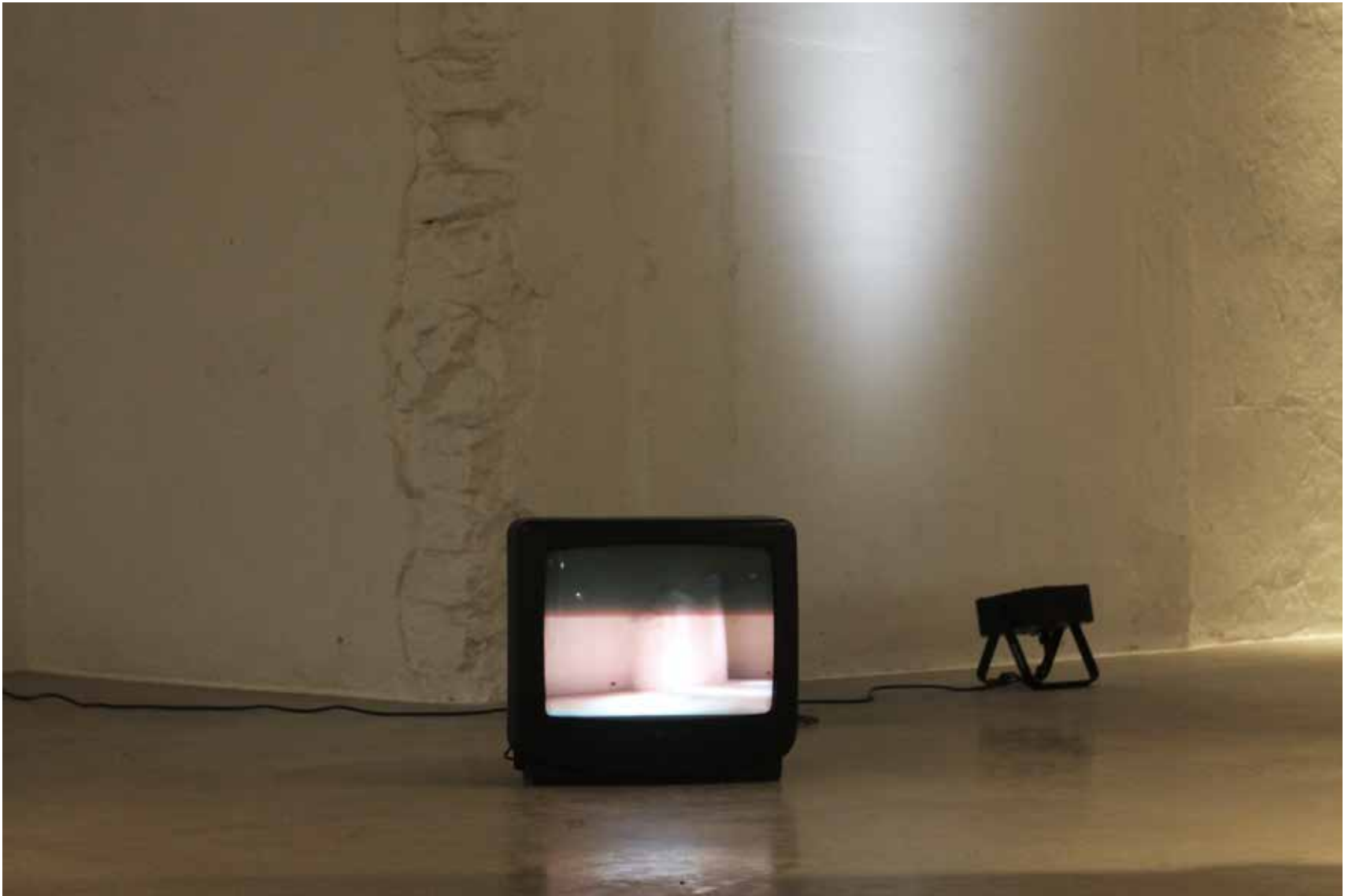
“Vare”, hoone arhitektuurne detail, valgus, teler