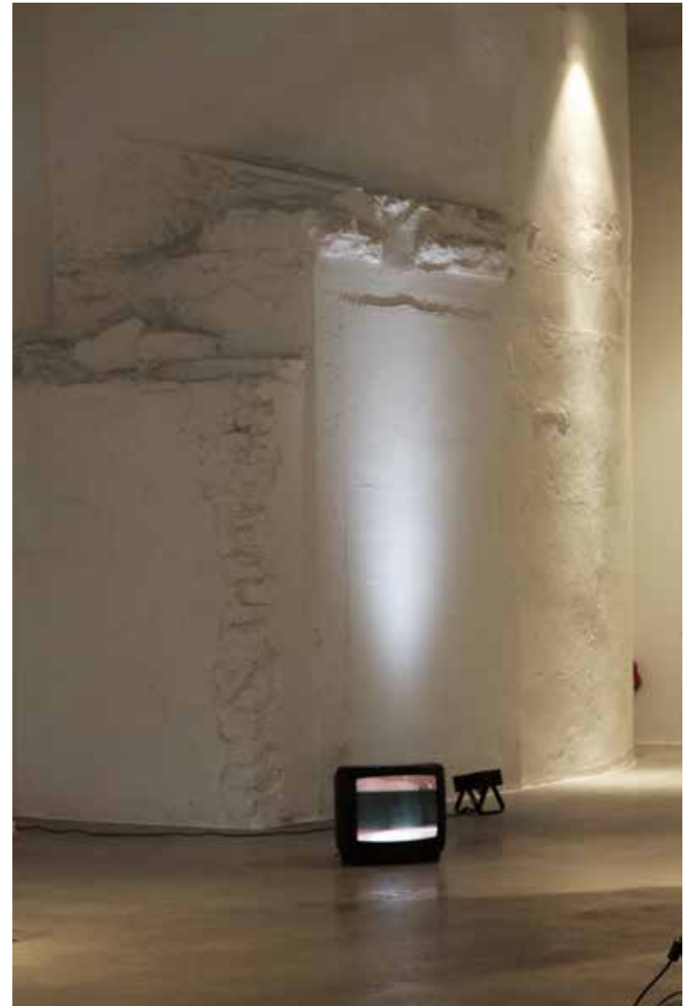
“Vare”, hoone arhitektuurne detail, valgus, teler