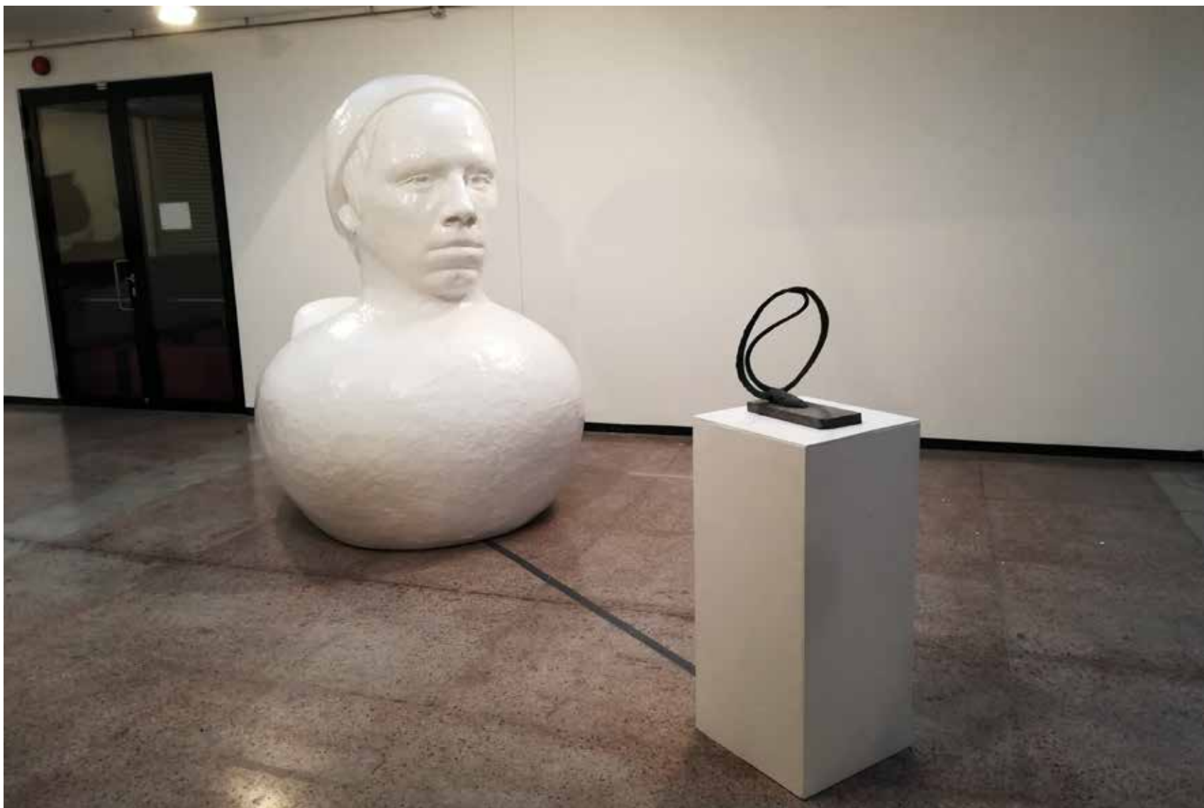
“Dialog isaga”, 2.4m kõrge plastikskulptuur, Jaan Luige 40cm kõrge pronksskulptuur , näituse vaade