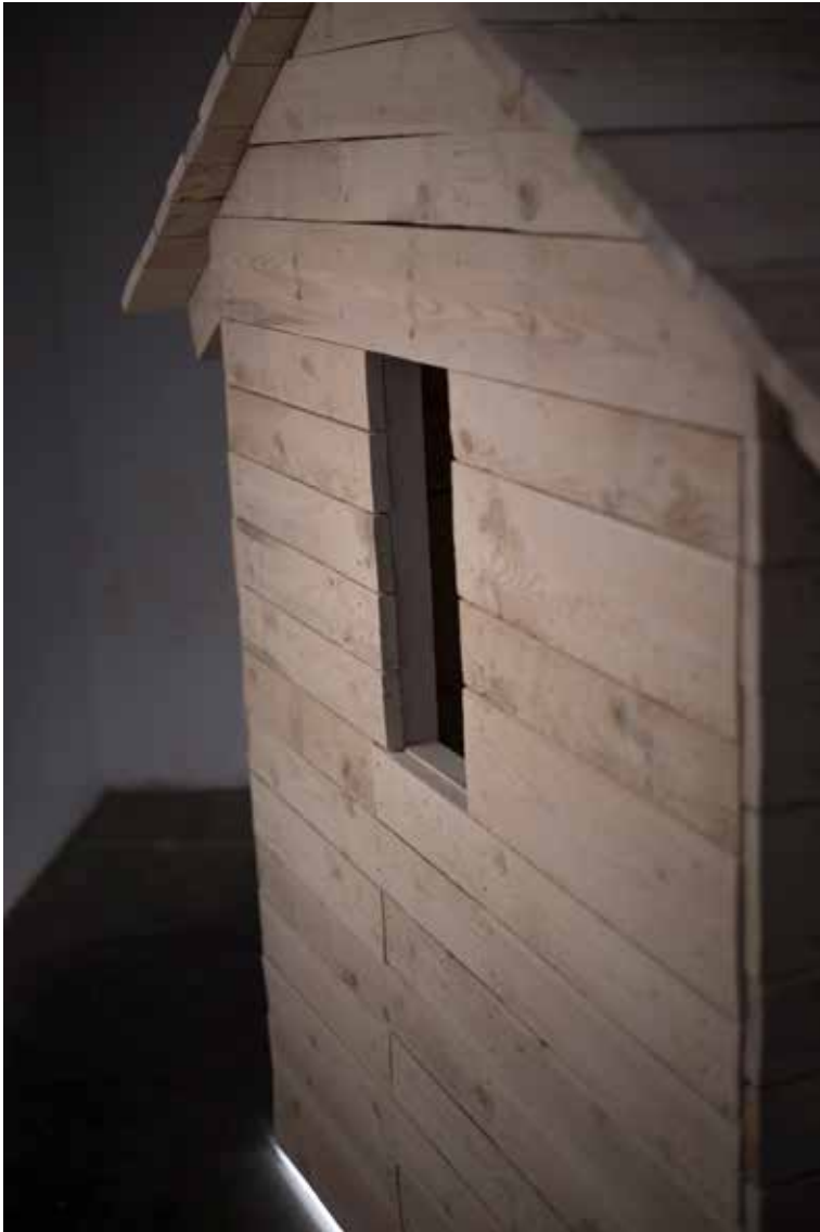
“Maja”, näituse detailid