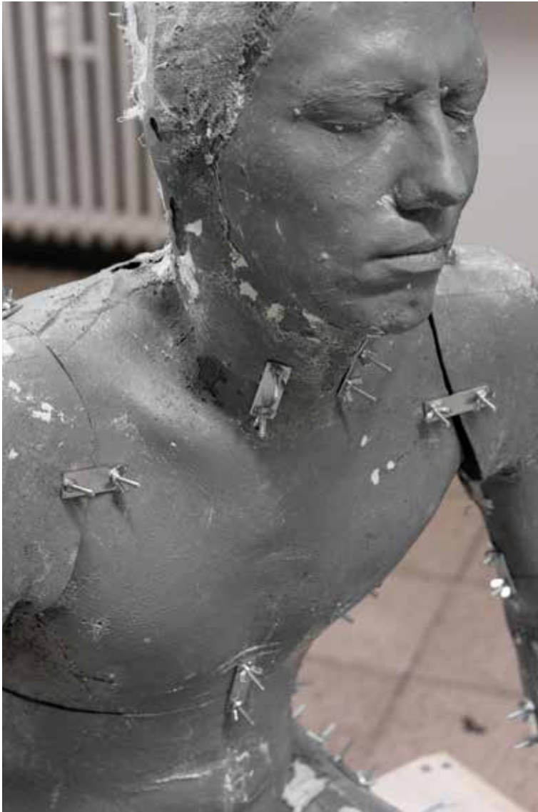
“Untitled”, skulptuuri detailid