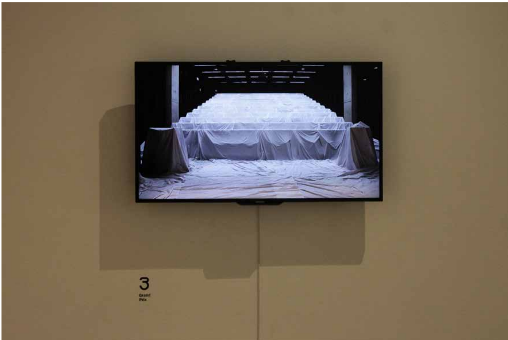
“Edasi lükatud ruum”, näitusevaade, video