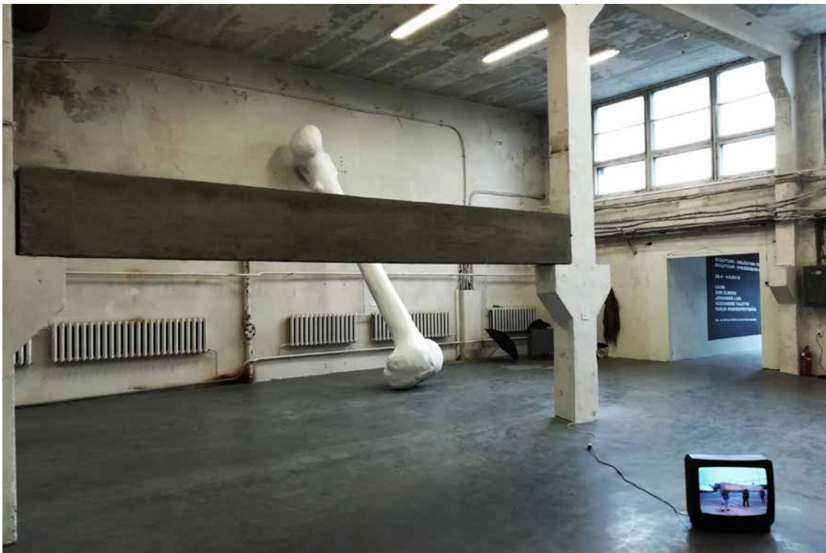
“Mõra”, 30x60cm läbimõõduga 6-meetrit pikk betoontala, teler