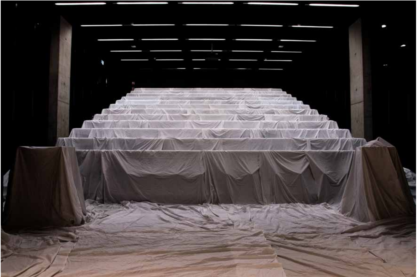
“Edasi lükatud ruum”, kohaspetsiifiline installatsioon kooli aulas, valged linad