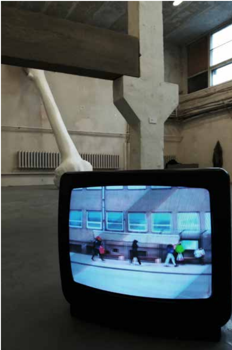
“Mõra”, 30x60cm läbimõõduga 6-meetrit pikk betoontala, teler