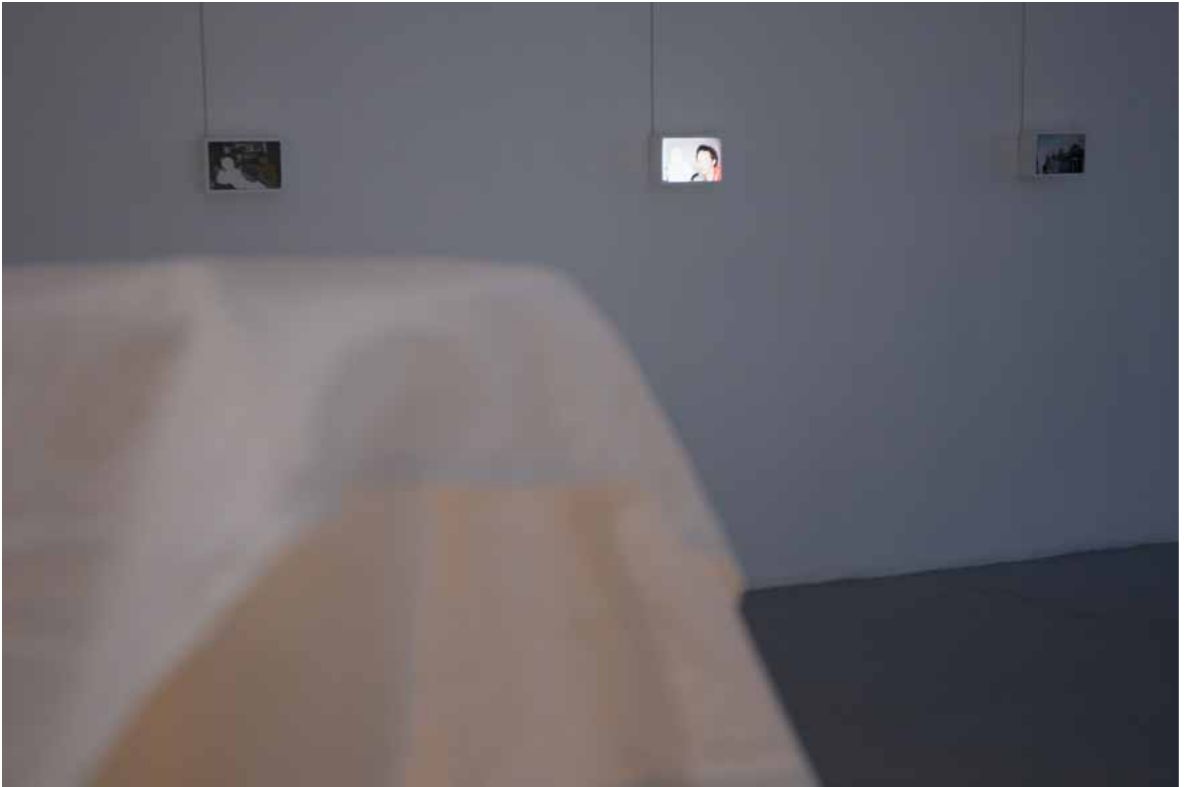
“Tulevikumälestus”, näituse detail